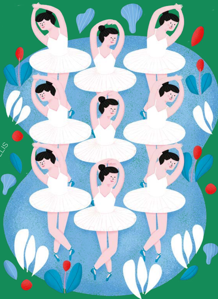
ILUSTRACIÓN: CAROLINA CELIS